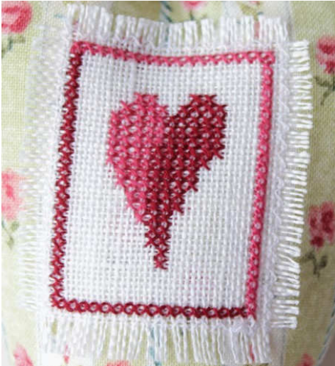
Vorlage In Originalgröße