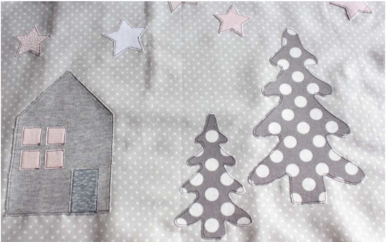
Vorlagen in Originalgröße abgebildet